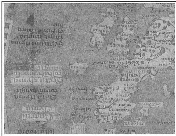
Mapa 2. Reproducció del Mapamundi d'A. Walsperger (II)