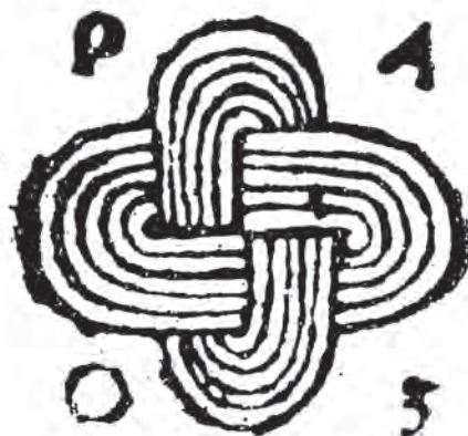
Fig. 1. Grabado «Nudo de Salomón», Retrato de la Lozana andaluza , Bruno Damiani (ed.), 1969

Veía a Plutón, caballero sobre la Sierra Morena ... veía venir a Marte ... Yo, que consideraba que podría suceder, sin otro ningún detenimiento cabalgaba en Mercurio que me parecía que hiciese el más seguro viaje ... en tal modo que navegando llegábamos en Venecia, donde Marte no puede estender su ira [...] Considerando cómo las cosas que han de estar en el profundo, cómo Plutón, que está sobre la Sierra Morena [...] yo quiero ir al paraíso [...] y solicitaré que vais vos si veo la Paz, la enviaré atada con este ñudo de Salomón, desátela quien la quisiere (Delicado, 2013: 243-244; mamotreto LXVI).