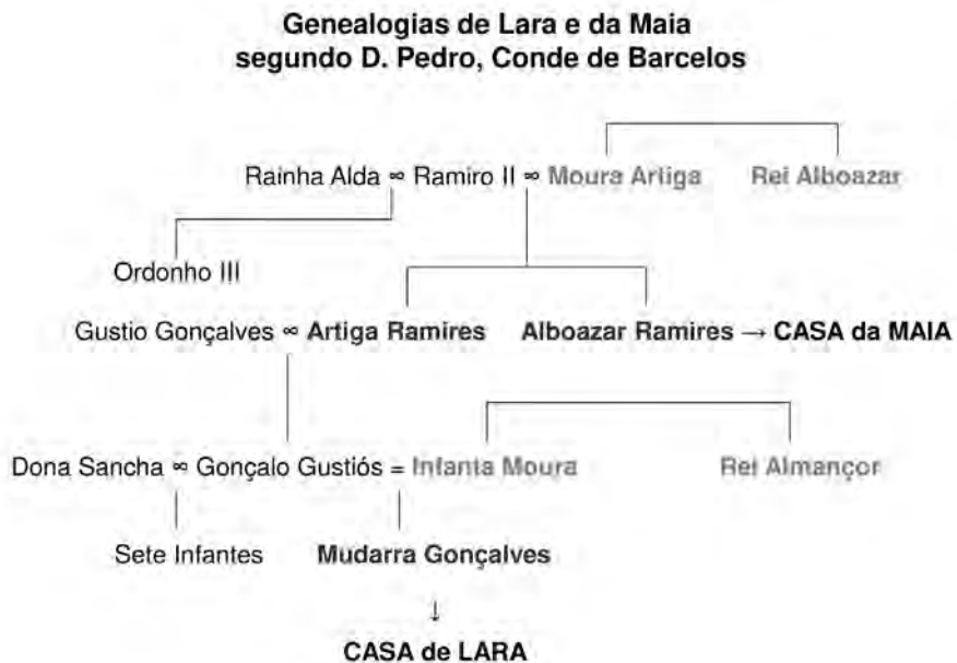
Figura 2: As linhagens escolhidas

em que cada uma dessas figuras é inserida transporta evocações de tipo providencialista 43 que, no contexto da escrita de Pedro de Barcelos, não podem senão prenunciar a vitória de Tarifa. Sintomaticamente, aqueles que, de acordo com o LLC , representam, no tempo de Pedro de Barcelos, as duas linhagens escolhidas, Álvaro Gonçalves Pereira e João Nunes de Lara III, e que irão ter um papel decisivo nessa batalha final da disputa da Espanha entre cristão e mouros 44 , transportam nas suas veias o sangue do antigo invasor, perpetuando e ratificando, assim, a presença e a legitimidade deste na terra comum.