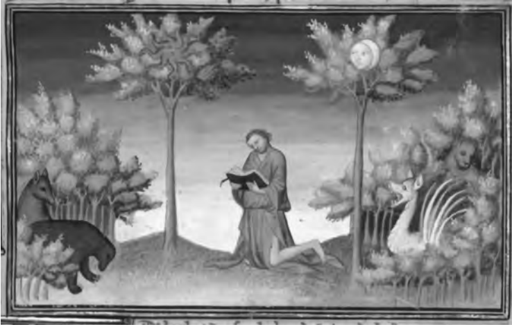
Figura 2: Árboles del Sol y de la Luna. Le Livre des Merveilles, 1400-1420, Paris, MS FR2810, f. 220r.

Finalmente, se ha debatido la aparición del Árbol del Sol en Los viajes de Marco Polo , pero sin su alter ego lunar. De hecho, Marco Polo describe en dos ocasiones (en la región de Tun-u-Qayn y de Jorasán) un Árbol Solo, que identifica como el Árbol Seco que aparece varias veces en la Biblia 22 . Si la traducción al castellano no deja lugar a equívocos, otras versiones del texto asemejan el Árbol Solo al Árbol del Sol y apoyan su comparación con la mención del viaje de Alejandro Magno (aunque en la versión castellana conste que este árbol no es el de la India, sino el que protege al rey durante su batalla contra Darío). La dificultad para la identificación de estos árboles deriva posiblemente de la similitud de los fonemas franceses seul y sol (respectivamente solo y sol ), que se presta a confusión 23 . Ahora bien, según Wittkower (1977: 89), la equivocación reside más bien en que varios textos de la materia alejandrina confunden el Árbol del Sol con el Árbol Seco en que anida el fénix: dos episodios muy cercanos, por ejemplo, en las páginas del Pseudo-Calístenes y en un manuscrito de la Historia Alexandri Magni (siglo XIII) conservado en la biblioteca universitaria de Leipzig, donde en el folio 88r aparece una miniatura del árbol del fénix y, en el folio contrapuesto en el códice, aparecen los árboles del Sol y de la Luna con un trazo parecido.