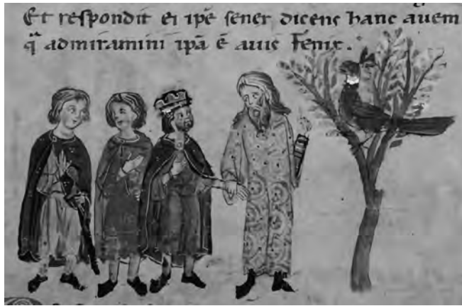
Figura 3: Árbol Seco, Historia Alexandri Magni , s. XIII, Leipzig, Cod. Rep. II 143, f. 88v.