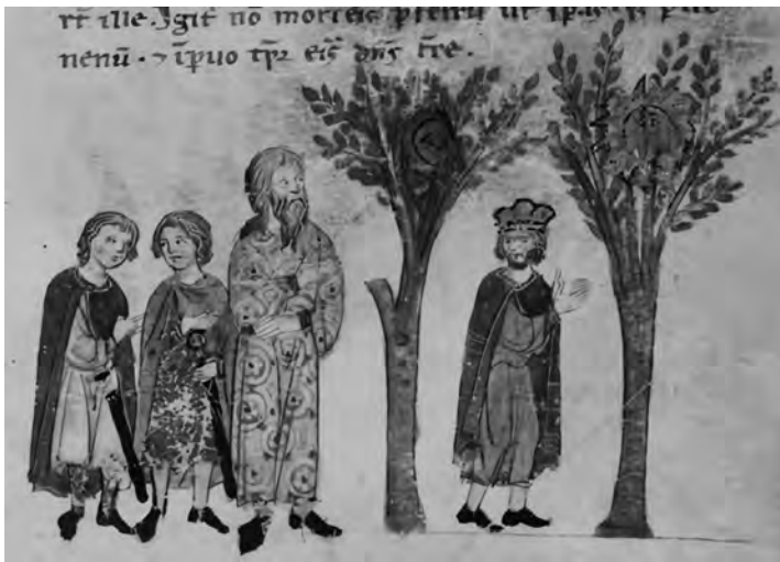
Figura 4: Árboles del Sol y de la Luna, Historia Alexandri Magni , s. XIII, Leipzig, Cod. Rep. II 143, f. 89r.

La confusión de los árboles se vuelve incluso más llamativa en el manuscrito MS Royal 15.E.Vi de la British Library , donde aparecen en el folio 18v los árboles proféticos y el Árbol Seco en una misma ilustración (Onuma, 2003: 111). En las reelaboraciones castellanas, el árbol seco del fénix se encuentra ausente del Libro de Alexandre , donde la legendaria ave aparece sin percha (ee. 2475-2476),