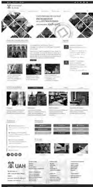
Fig. 1: <www.uah.es>