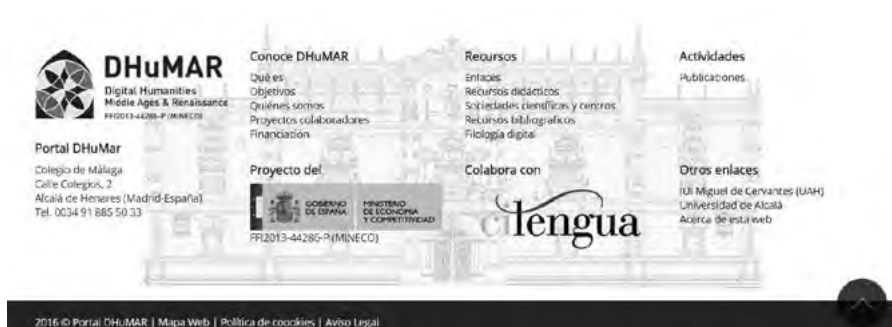
Fig. 5: Pie de página.

En el sub-apartado «Equipo» encontramos los Investigadores Principales del proyecto, los Investigadores y los miembros del Equipo de trabajo. Para agilizar la búsqueda aparecen unos recuadros con los nombres de cada uno, su afiliación, los enlaces principales y una fotografía (fig. 6). Al pinchar en el nombre, aparece una nueva página con un breve resumen de la trayectoria académica e investigadora de cada uno de los integrantes del proyecto (fig. 7).