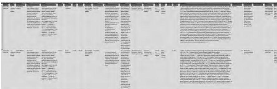
Fig. 8: Base de datos de traductores que se está creando.

Esta primera pestaña describe la base de datos principal de este portal y hace referencia a la ampliación del proyecto primigenio CHTAC en CHTIM . Catálogo Hipertextual de Traducciones Ibéricas Medievales , llevada a cabo para poder reunir no solo las traducciones anónimas sino también las que tienen traductor conocido (fig. 8). Las nuevas fichas que se han creado irán acompañadas de una nota bio-bibliográfica sobre el traductor, una información fundamental y transversal.