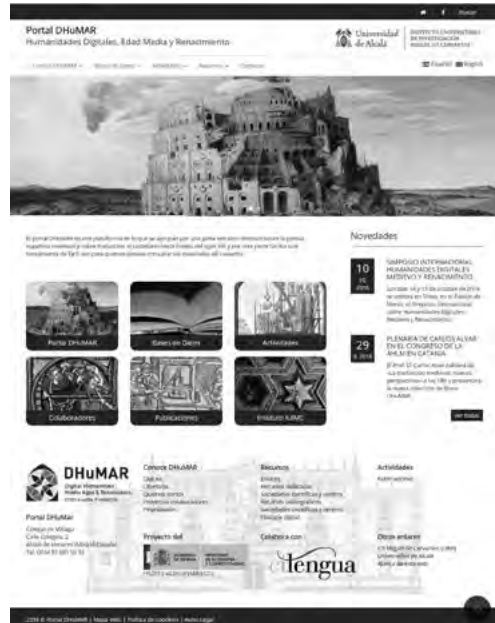
Fig. 2: <http://www.3uah.es/DHuMAR/>

Se trata de un diseño muy sencillo que evita en la medida de lo posible efectos tipo flash o java, para que no aparezcan problemas de visualización en los distintos tipos de dispositivos y para que sea accesible a personas con capacidades diferentes.