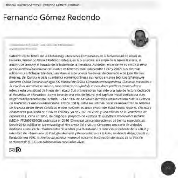
Fig. 7. CV breve.

Las otras pestañas son algunas de las bases de datos que conforman el portal. No son enlaces directos, sino breves explicaciones sobre las mismas 8 .