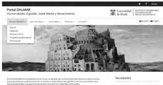
Fig. 3: Header DHuMAR

Tiene un header (fig. 3), o sea, una cabecera donde aparece el título y el logo del IEMSO.