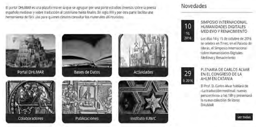
Fig. 4: Texto presentación, botones de acceso rápido y apartado novedades.

A la derecha de la página aparecen las novedades —en formato «Feed RSS», es decir, un archivo generado automáticamente que contiene una versión específica de la información publicada en nuestro portal y que se reescribe automáticamente cuando se produce alguna actualización en los contenidos del sitio web—, que pueden ser por ejemplo la participación de algunos de nuestros miembros en un congreso (hablando de nuestro proyecto o con temas relacionados o afines), la publicación de un nuevo libro (financiado por el proyecto, o de tema análogo, sea sobre poesía sea sobre traducción, medieval o renacentista), un curso que podamos organizar o co-organizar, etc.