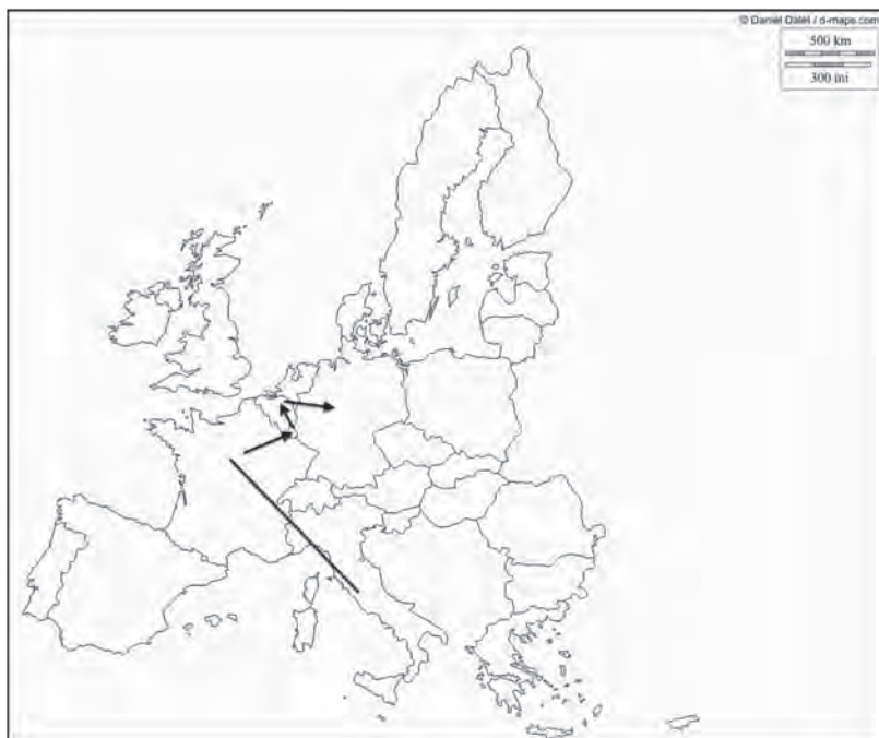
Figura 2. Il percorso di Sevilla Le frecce indicano il percorso verso l'Ungheria, mentre la linea retta quello della via Francigena.

È certamente sorprendente la precisione con cui il testo specificò con tanta dovizia di dettagli gli spostamenti di Barroquer e della regina. Non è da escludere che l'anonimo autore (già del testo antico francese dal quale si traduce) abbia pensato a un itinerario vincolato ai percorsi della Hanse, ovvero quelle vie che collegavano la Germania, la Polonia, i Paesi Bassi, il Belgio, la Danimarca, la Svezia, l'Estonia, la Lettonia, la Lituania e la Russia. È altrettanto noto che l'area maggiormente popolata, per via degli intensi scambi commerciali, sia quella del Reno, nei pressi di Colonia, città dalla quale i due protagonisti passano, così come tutta l'area regionale francese della Champagne guardava con interesse a quelle zone. 12 Dal punto di vista strettamente storico, pare che le città menzionate dall'autore costituivano i percorsi tanto dei commerci, così come dei viaggiatori, e ciò non stupisce poiché i viaggiatori preferivano utilizzare le stesse vie dei commerci per ragioni di sicurezza. 13