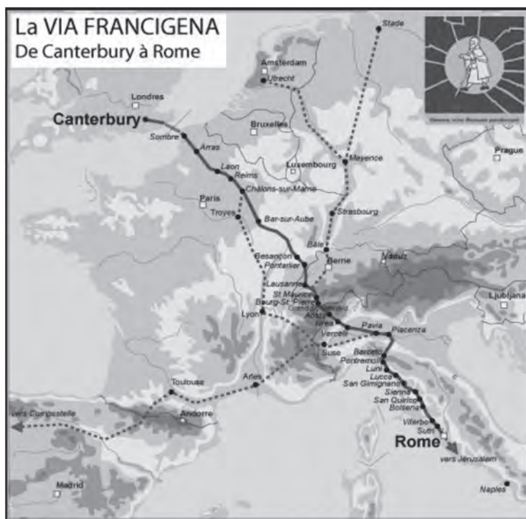
Figura 1. La via Francigena

Il re, in pratica, allude alla via Francigena, quella strada che da Canterbury collegava la Francia e la Svizzera a Roma: