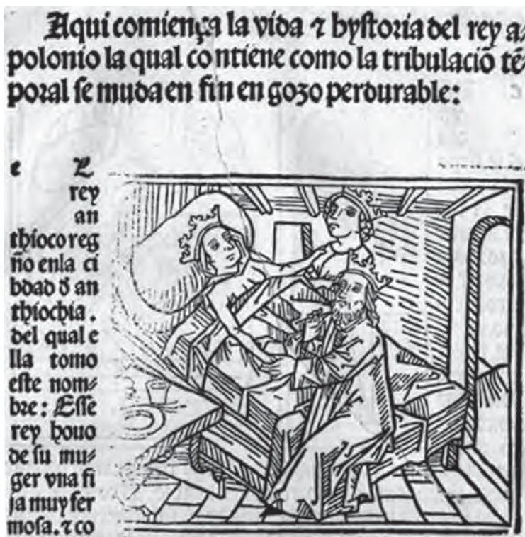
Ilustración 2: Vida e historia del rey Apolonio [Zaragoza: Juan Hurus, ca.1488]. Incipit. Nueva York, HSA.

Dinckmut, 1495), pero con grabados copiados toscamente, incluso, en algún caso parcialmente modificados, para introducir elementos cristianos.