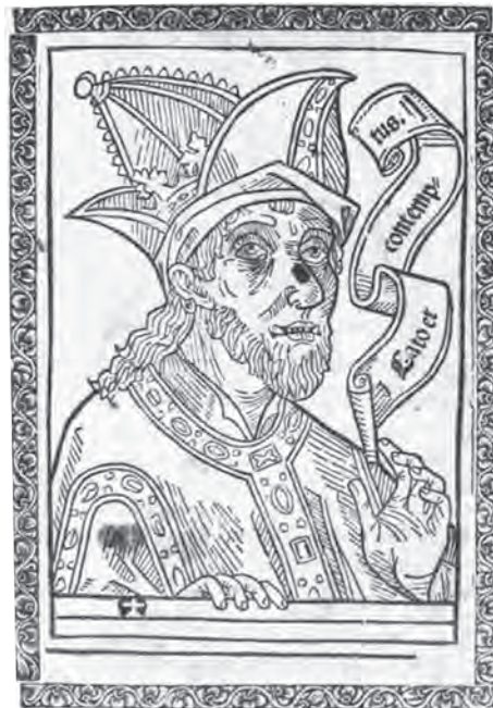
Ilustración 4: Catón, Cato et contemptus , Zaragoza: Jorge Coci, 30 de mayo de 1508. Portada. Zaragoza, BUZ, An_7_5_18.