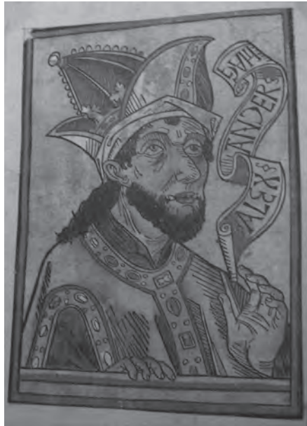
Ilustración 3: Steinhöwel, Heinrich, Die hystori des küniges Appoloni , Augsburgo: Johann Bämler, 1476. Portada. Berlín, SBB, Inc.73.