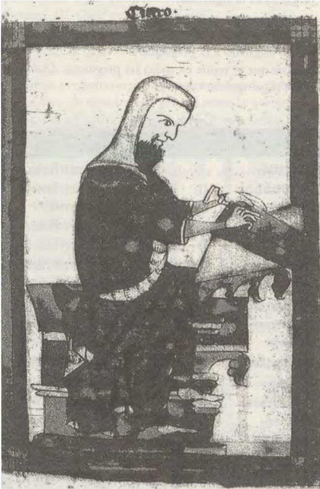
Lámina I - Oxford, Bodleian Library, Digby, ms. 46, fol. 77'

bir con un estilo en unas tablillas. 8 En otros libros de suertes del mismo manuscrito relacionados con otros autores aparecen también los dibujos de estos personajes (por ejemplo, Sócrates, Pitágoras o Anaxágoras) en un contexto y actitud similares.