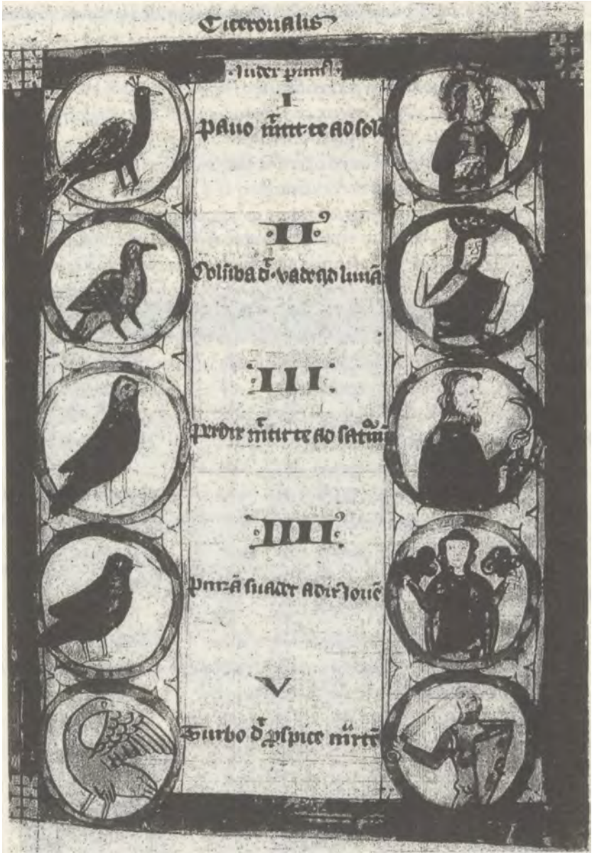
Làmina III - Oxford, Bodleian Library, Digby, ms. 46, fol. 78'