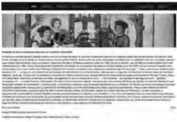
Fig. 2: Portada de las Heures à l'usage de Rome (París: Geoffroy Tory, 1525).

En el segundo (Figura 2), se ha escogido una escena del libro Heures à l'usage de Rome (París: Geoffroy Tory, 1525), ilustrado con miniaturas como posible regalo de bodas a los descendientes de dos célebres familias de impresores. En la portada, atribuida al iluminador Étienne Collault, se representa una prensa, de la que también se visualizará un recorte en cada ficha.