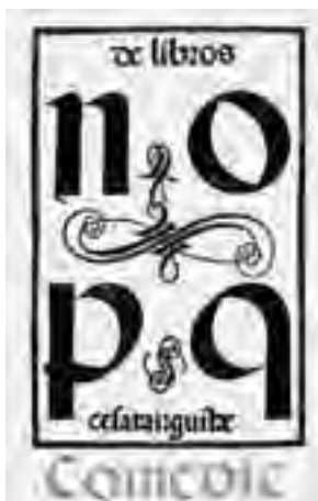
Fig. 1: Grabado manipulado de la obra de Juan de Iciar, Ortografía práctica (Zaragoza: Bartolomé de Nájera, 1548).

tica , primer tratado de caligrafía español, editado por vez primera en Zaragoza (1548), y cuya imagen se ha manipulado para ajustarla a nuestros intereses.