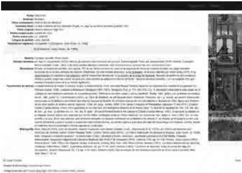
Fig. 3: Ficha dedicada a la Historia de Apolonio [Zaragoza: Juan Hurus, ca. 1488]