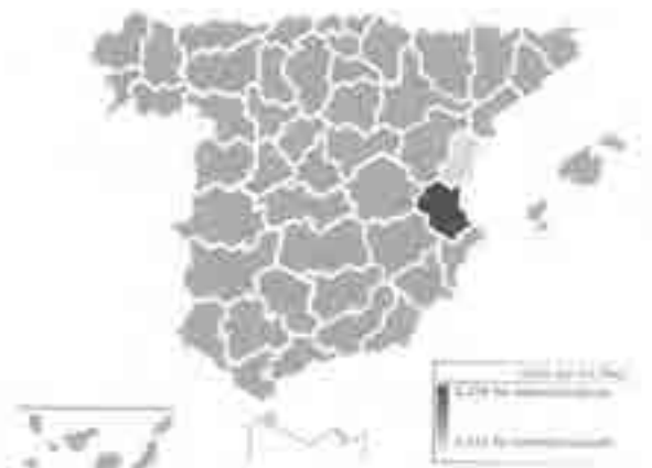
Distribución del apellido Ferragud . 1-1-2015

La forma Ferragud es muy poco frecuente y casi todos los ejemplos proceden de Valencia: