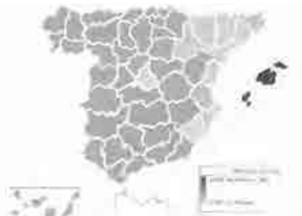
Distribución del apellido Ferragut . 1-1-2015

nes irrelevantes en otras provincias. Apenas quedan vestigios de Ferragut en Aragón (Zaragoza y Huesca) y en zonas repobladas por aragoneses, como Murcia 11 :