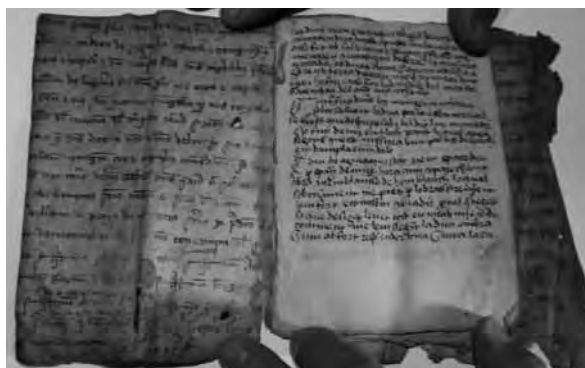
I. La Garrotxa (Girona), arxiu particular. Inici del text (dreta), fol. 1.