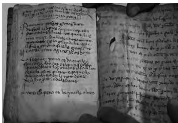
II. La Garrotxa (Girona), arxiu particular. Final del text (esquerra), fol. 14v°.