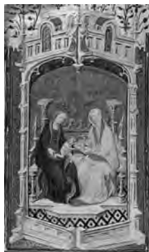
Fig. 4. «Ana triple», Oraciones añadidas al Libro de Horas Beaufort-Beauchamp , Inglaterra y Países Bajos (1401-1415). Londres, British Library, Ms. Royal 2A. XVIII, fol. 13v.