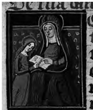
Fig. 2. Libro de Horas de Meaux , Paris (1480-1490 ca.). Troyes, Bibliothèque Municipale, Ms. 1894, fol. 109r.