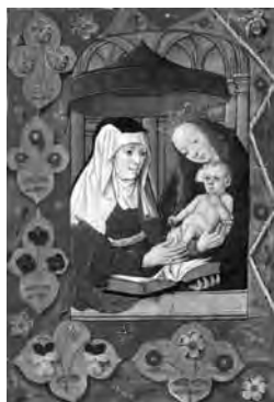
Fig. 5. «Ana triple», Libro de Horas de Enrique VIII y Ana Bolena , proveniente de los Países Bajos (1500 ca.). Londres, British Library, Ms. King's 9, fol. 66v.