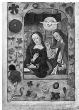
Fig. 8. «Anunciación», Libro de Horas de Enrique VIII y Ana Bolena , proveniente de los Países Bajos (1500 ca.). Londres, British Library, Ms King's 9, fol. 66v.