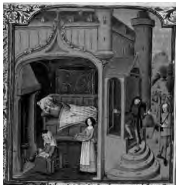
Fig. 19. Cuarto volumen de L'Istoire Scolastique . Biblia historiada o historia bíblica de Guyart des Moulins (1470-1479 ca.). Londres: British Library, Ms. Royal 15 D.I., fol. 18r.