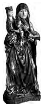
Fig. 3. Santa Ana triple , Retablo de Santa Ana de la Capilla del Condestable (hacia 1500), Catedral de Burgos. Obra de Gil de Siloé Amberes? hacia 1440-Burgos 1504).