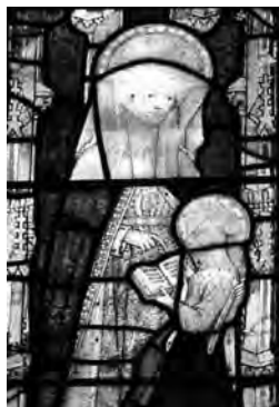
Fig. 1. Vidriera en la Antecapilla del Colegio de Todos los Santos, (1441 ca.) en Oxford (Inglaterra).