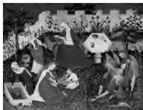
Fig. 10. María en el huerto cerrado, con santos , Inglaterra y Países Bajos (1410 ca.). Frankfurt Städel, n.º inv. HM 54.