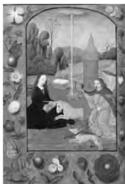
Fig. 9. «La caza de la Anunciación», Libro de Horas de la Virgen . Países Bajos, Utrecht, (1500 ca.). Nueva York: Morgan Library, Ms. G.5, fol. 18v.