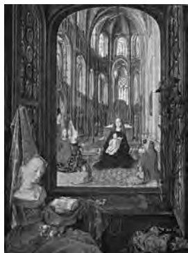
Fig. 18. «María de Borgoña en oración», Libro de Horas de María de Borgoña , Belgio (1480 ca.). Vienna, Österreichische Nationalbibliothek, Codex Vindobonensis 1857, fol. 14v.