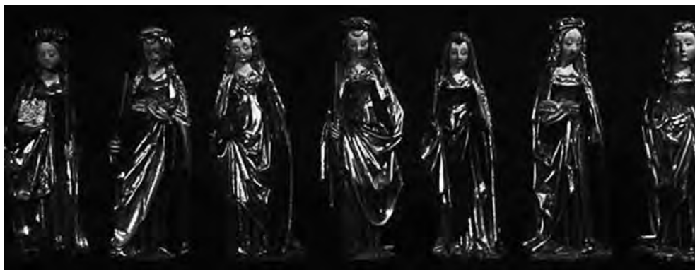
Fig. 11. Figuras de santas en hornacinas , Retablo de Santa Ana de la Capilla del Condestable (hacia 1500), Catedral de Burgos. Obra de Gil de Siloe-Diego de Siloe.