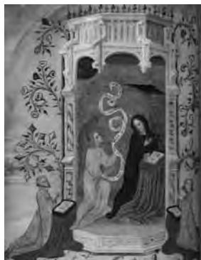
Fig. 7. «Anunciación», Oraciones añadidas al Libro de Horas Beaufort-Beauchamp , Inglaterra y Países Bajos (1401-1415). Londres, British Library, Ms. Royal 2A. XVIII, fol. 23v.