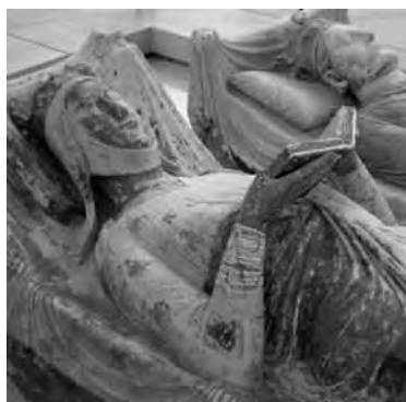
Fig. 17. Efigie tumbal de Leonor de Aquitania (principios siglo XIII) en su tumba de la Abadía de Fontevrault, Anjou (Francia).