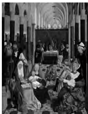
Fig. 6. Gerardo de San Juan, La familia de la Virgen , Países Bajos (1485-1490). Óleo sobre tabla, 137,2×105,8 cm. Amsterdam: Rijksmuseum.