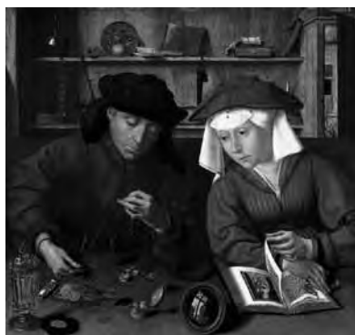
Fig. 20. Quentin Massys, El cambista y su mujer (1514). Óleo sobre tela, 71x68 cm. París: Museo del Louvre.