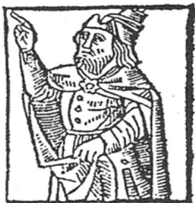
Figura 9. Exemplario , Fadrique de Basilea, 1498, f. 50r

Namias goza el a uariento delo que tiene.