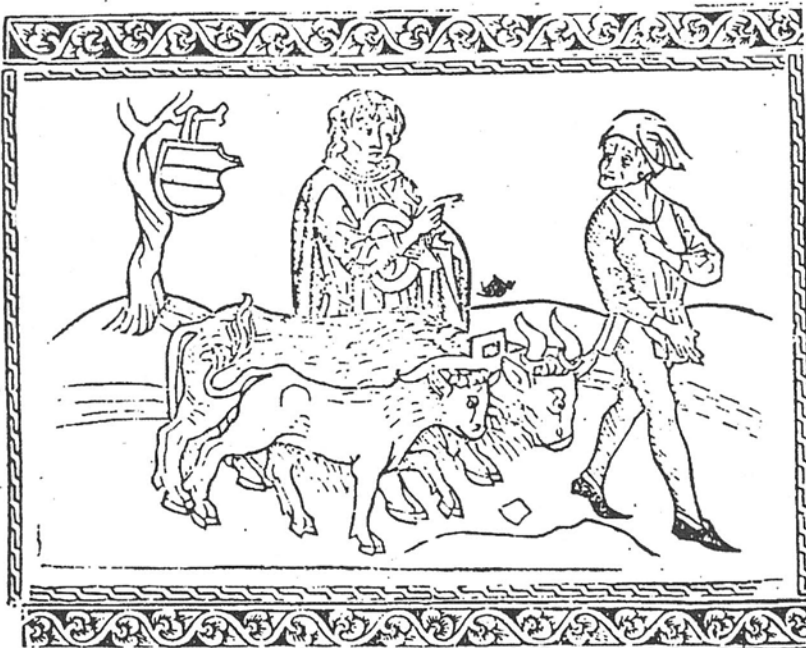
Figura 1. Exemplario , Pablo Hurus, 1494, f. 13v