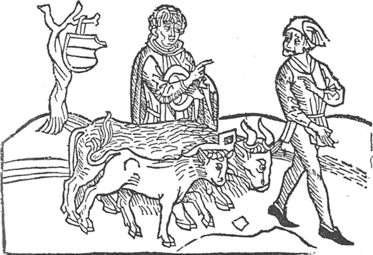
Figura 3. Exemplario , Pablo Hurus, 1493, q6 a