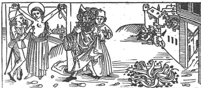
7. R-23859 BN-Ágata

Comiença la bystoria de la vida de santa ynes vírgen 7 martyx.