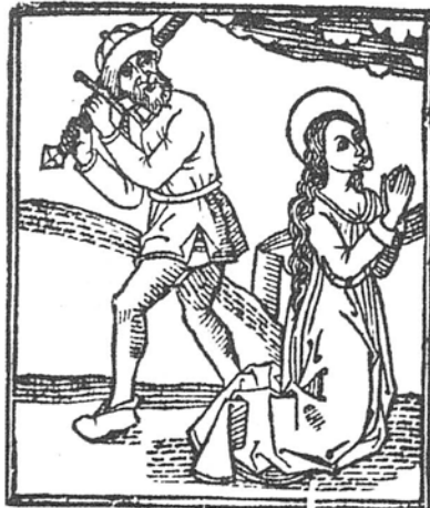
5. R-13032 BN-Eufemia