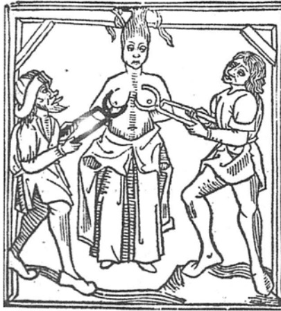
4. R-13032 BN-Bárbara