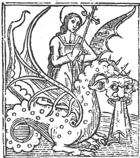
6. R-13032 BN-Margarita