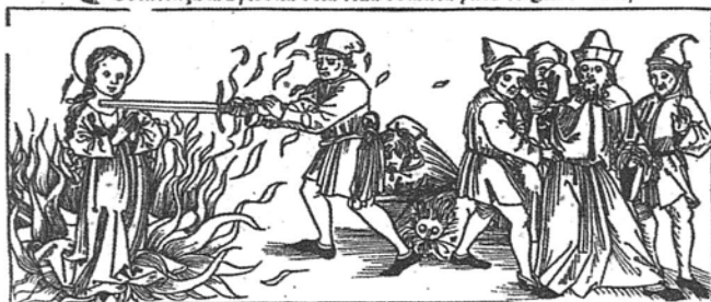
8. R-23859 BN-Inés

Comiença la bystoria de la vida de santa ynes vírgen 7 martyx.