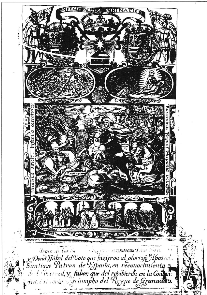
Privilegio de Voto de Granada. Alcalá de Henares, 1492 (copia impresa).